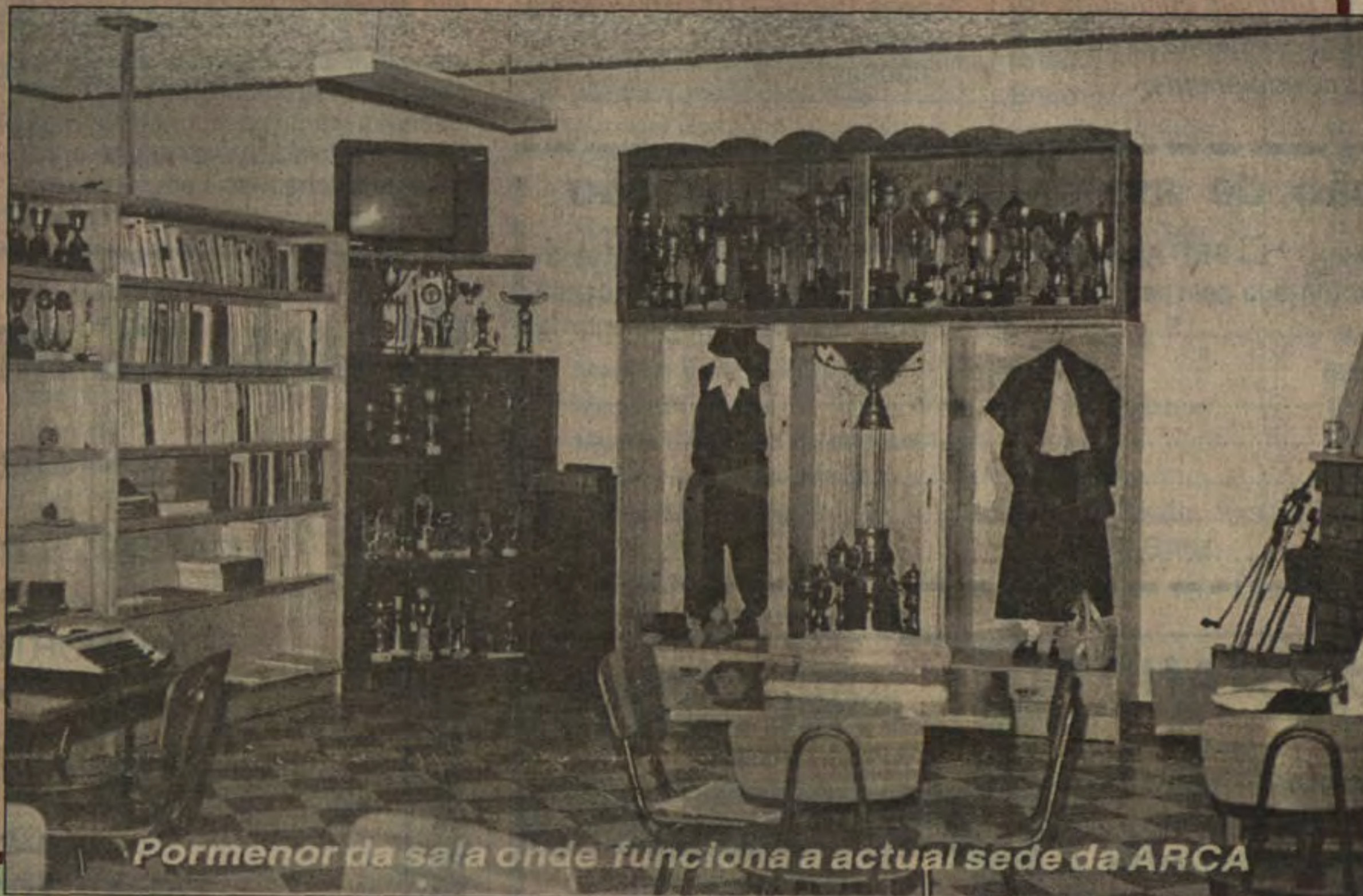
Pormenor da sala onde funciona a actual sede da ARCA