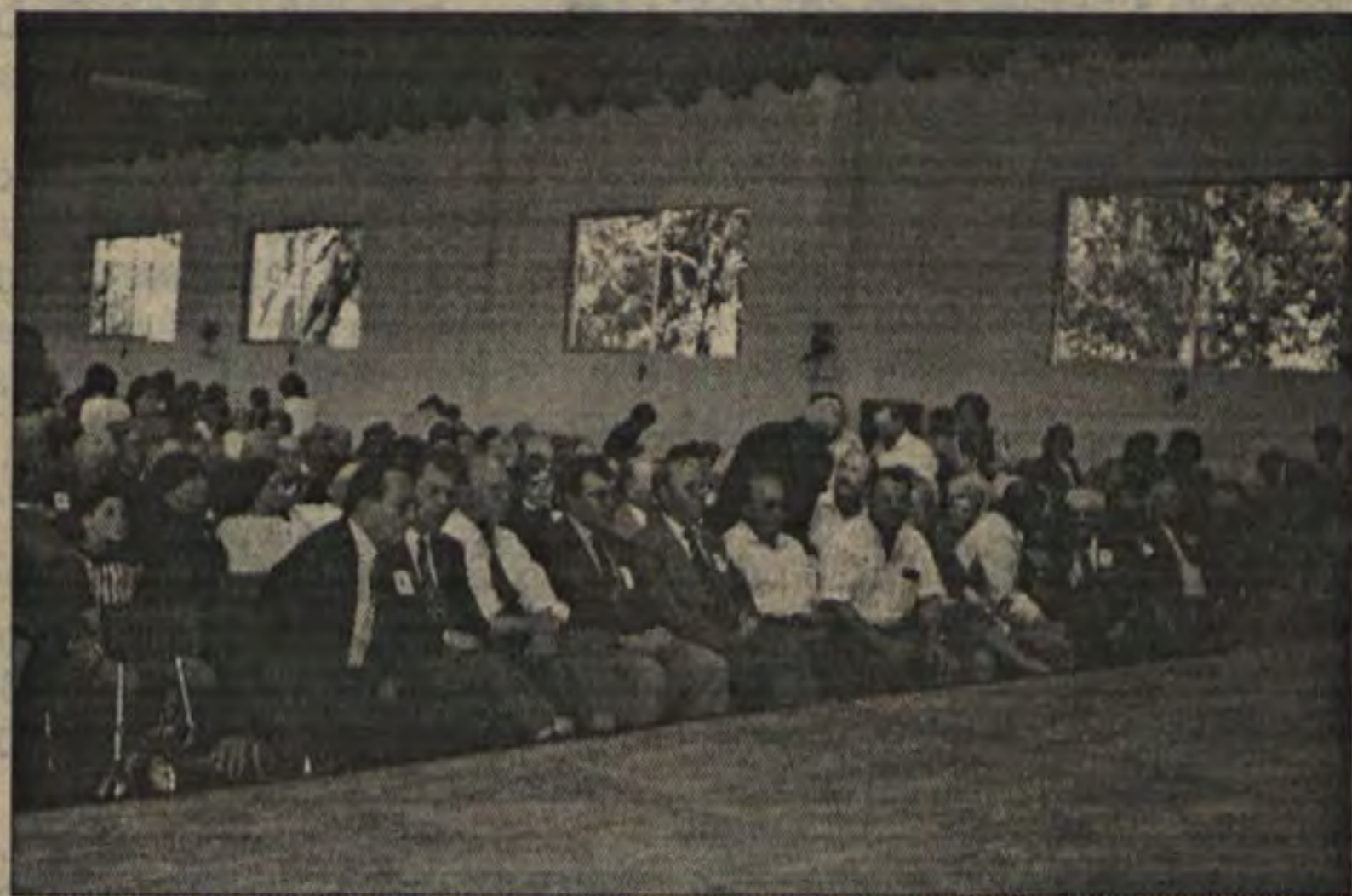
Aspecto do Encontro de Idosos, vendo-se na primeira fila representantes do Centro de Dia de Arega