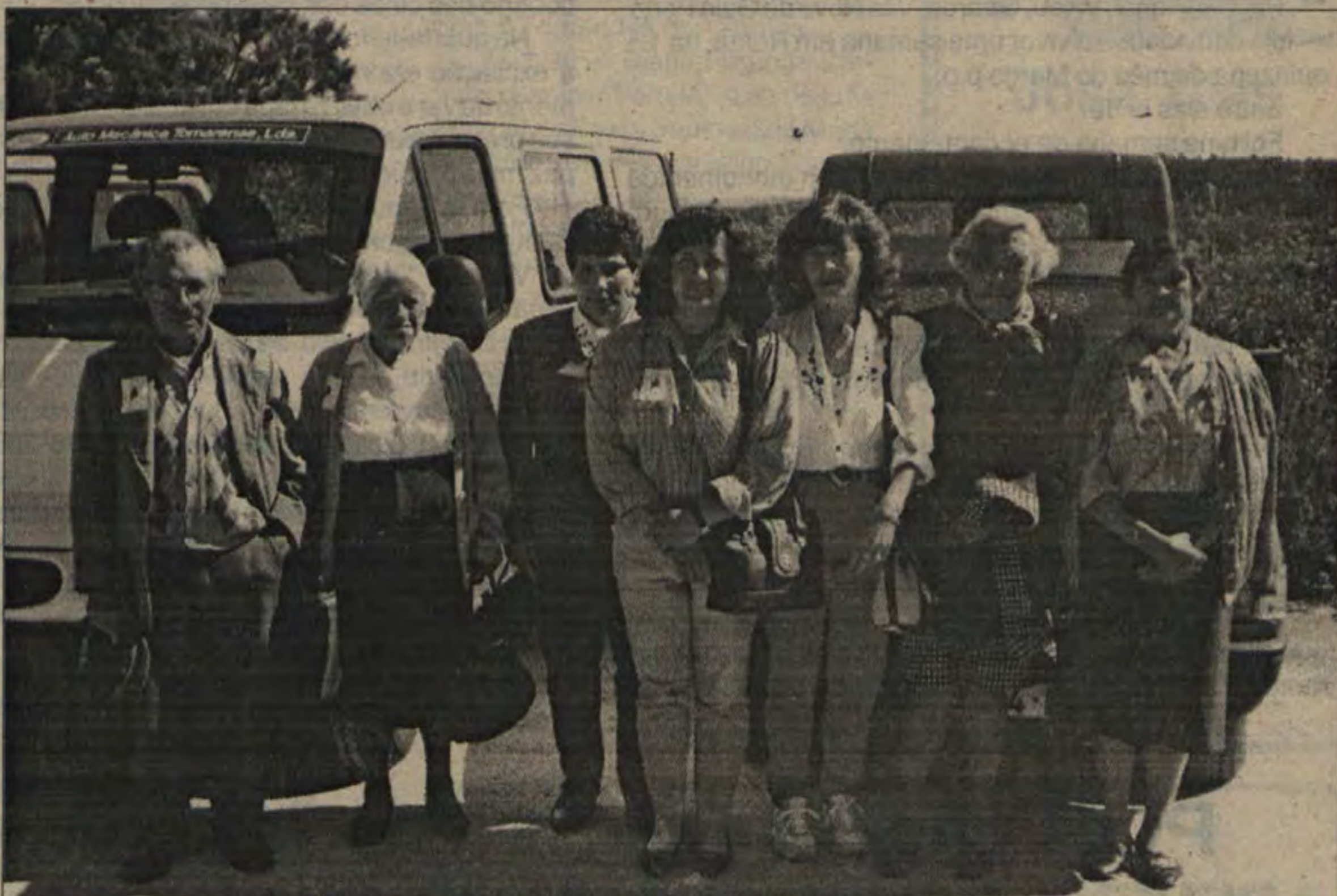
Idosos de Arega junto às duas carrinhas do Centro de Dia, acompanhados pelas três funcionárias

Realizou-se no passado dia 25 de Maio, em Figueiró dos Vinhos, o 10.º Encontro Distrital de Idosos em Instituições, ao qual acorreram representações de todo o distrito de Leiria,