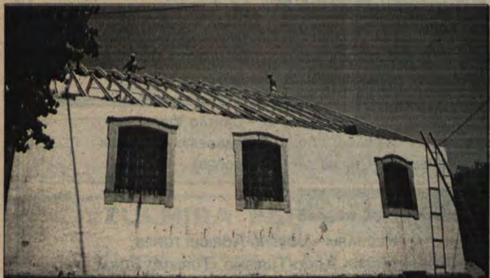
Fase das obras de restauro da sacristia da Igreja Paroquial