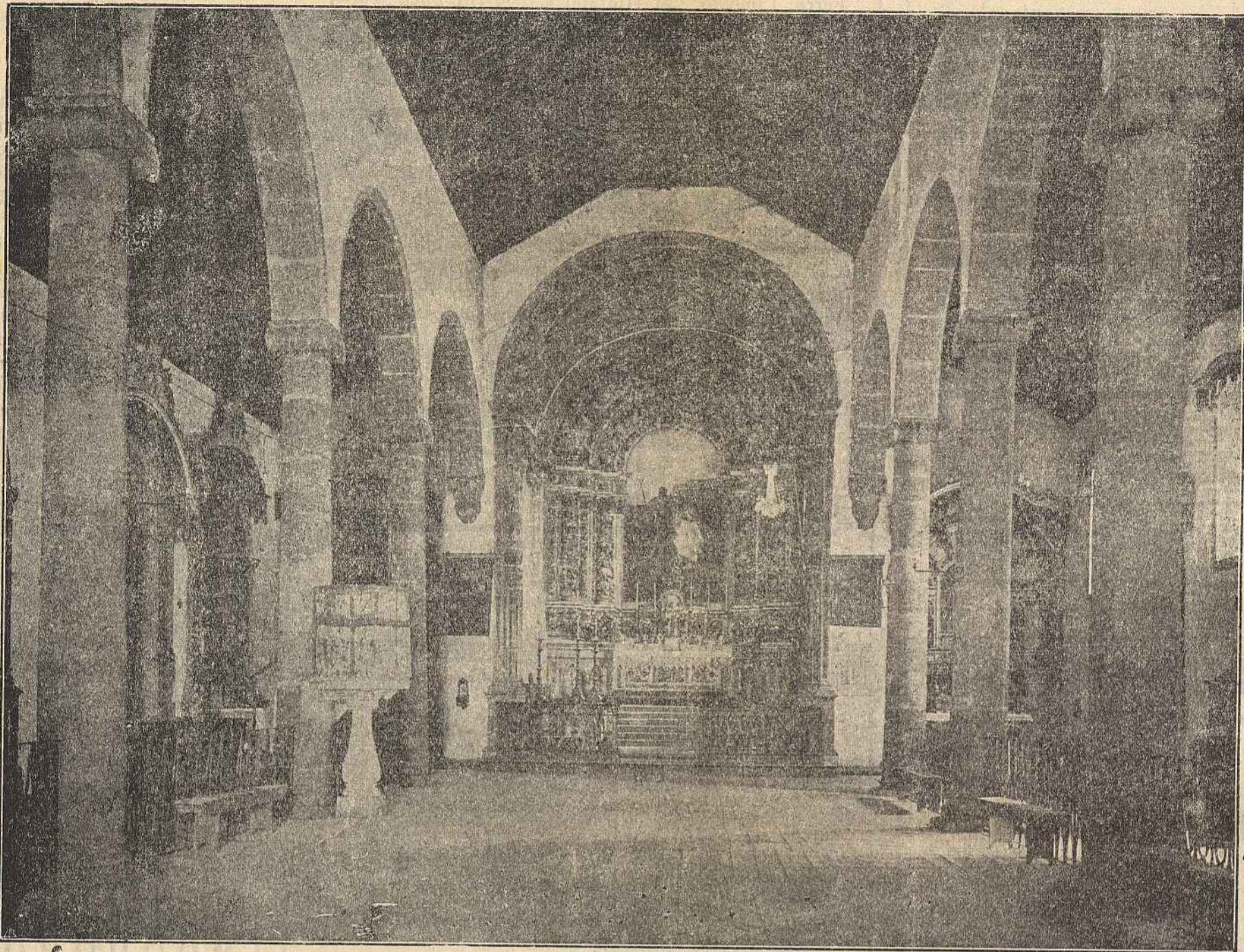
Interior da Igreja Matriz de Figueiró dos Vinhos, vendo-se, ao fundo o célebre quadro de Malhoa 'Baptismo de Cristo'. O vetusto templo — monumento nacional — está a soltar importantes obras de beneficiação.