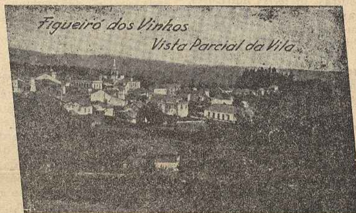
Figueiró dos Vinhos Vista Parcial da Vila

Mais uma vez, o produto das Festas se destina aos Bombeiros Voluntários (Corporação) pelo que é de esperar e desejar a melhor colaboração do público