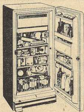
MODELO HA 2430 CAPACIDADE: 200 Litros (7 pés cúbicos)