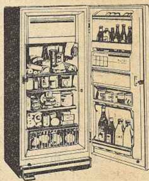
MODELO HA 2440 CAPACIDADE: 240 Litros (8,4 pés cúbicos)