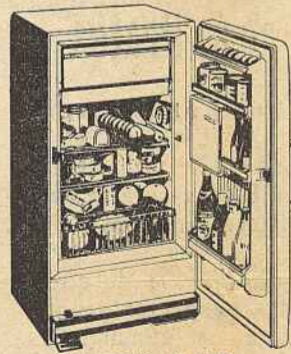
MODELO HA 2420 CAPACIDADE: 170 Litros (6 pés cúbicos)