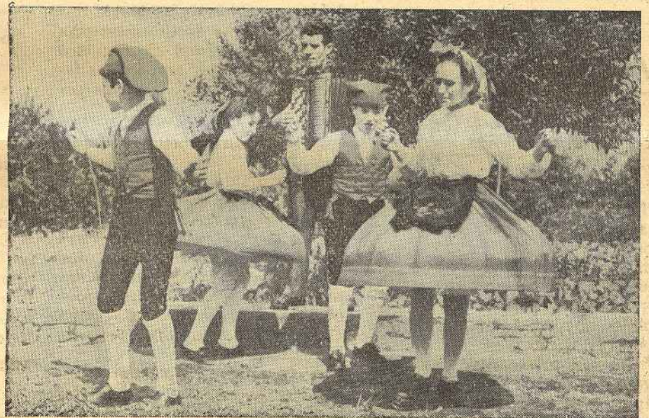
O Conjunto exibindo o folclore Ribatejano