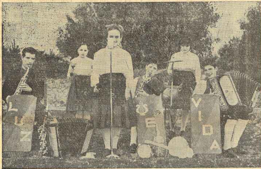
Conjunto «LUZ e VIDA»