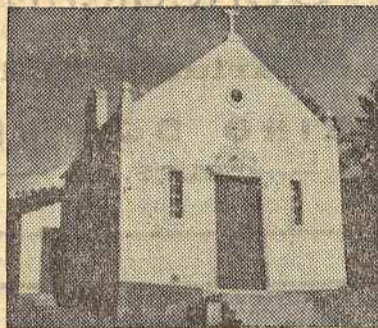
Capela da Ribeira Velha