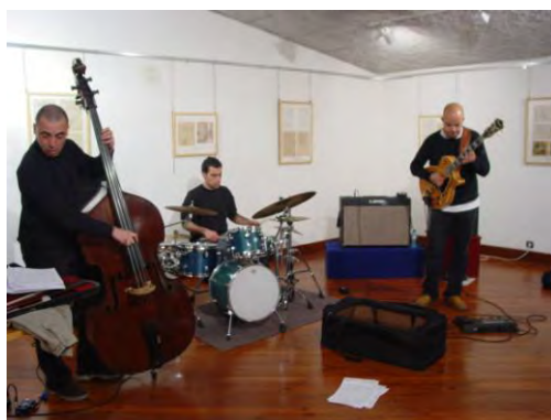
Concerto de Jazz realizado na Casa da Cultura