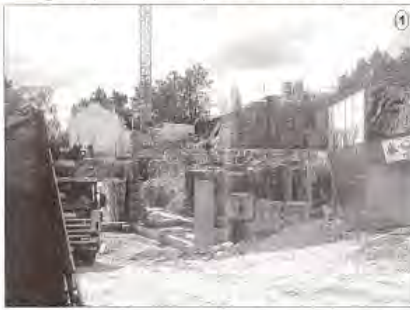
Foto 1: POLO DE FORMAÇÃO – A conclusão da construção do Polo de Formação de Figueiró dos Vinhos vem se em uma malhadinha ainda durante o corrente ano. Trata-se de uma forte aposta da Autarquia figurense na área da formação que permitirá dar cumprimento aos objetivos que estão na base da sua criação e que passam pela disponibilização de recursos adequados à formação, apoio técnico de base, orientação, qualificação no ato de reconhecer.

Em comum, todas estas obras têm o facto de estarem - previsivelmente - concluídas durante o corrente ano.