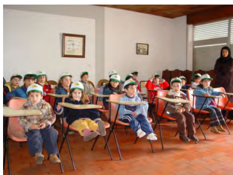
Dia Mundial da Árvore