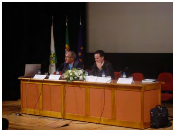
Colóquio sobre o mel realizado na Casa da Cultura