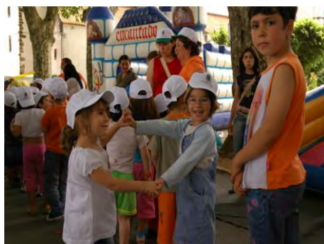
Dia Mundial da Criança