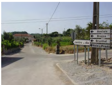
Calçada em Arega