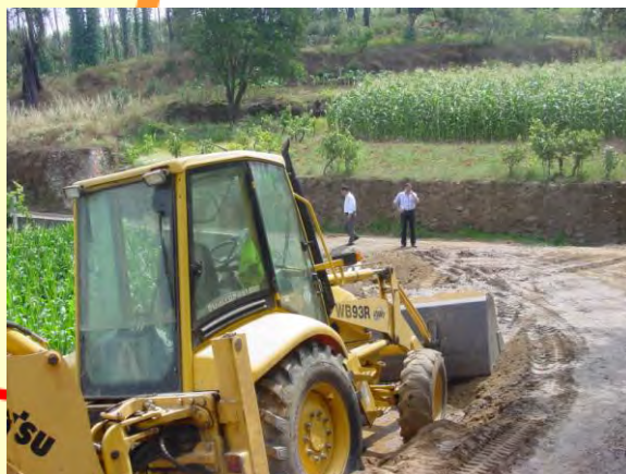
Beneficiação de estrada e construção de muro de suporte de terras em Casalinho – Arega – Obra realizada em parceria com a Junta de Freguesia de Arega