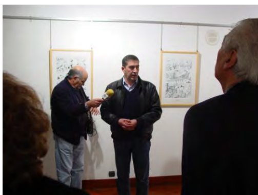
Inauguração de exposição de banda desenhada na Casa da Cultura