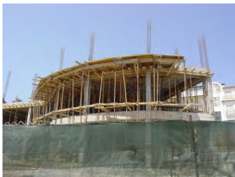
Pólo de Formação em construção