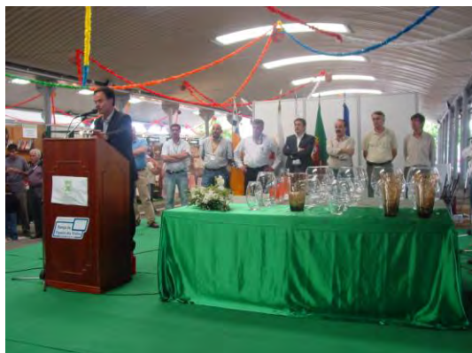
Cerimónia de entrega de prémios da Rampa de Figueiró dos Vinhos