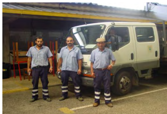
Novas fardas de trabalho para o funcionários externos da Câmara Municipal