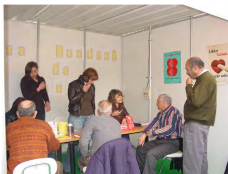
Dia Mundial da Saúde