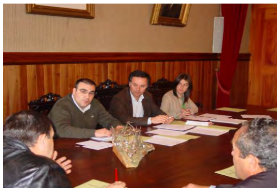
Reunião da Comissão Municipal de Defesa da Floresta