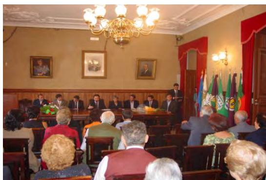
Cerimónia de atribuição de prémios do concurso Figueiró Florido