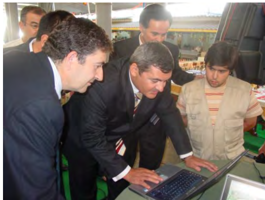
Inauguração da rede Wireless