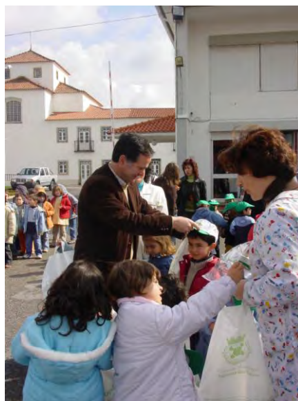
Comemoração do dia mundial da árvore