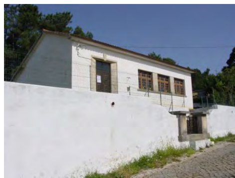
Aplicação de vedação e de portão na escola de Carreira - Arega