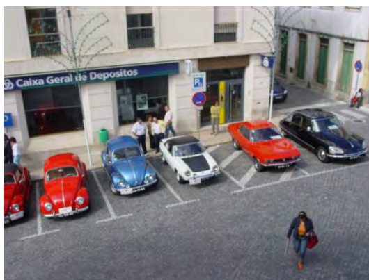
Encontro automóvel "Clássicos de Figueiró"