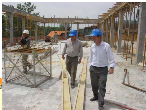
Pormenor do primeiro piso do Pólo de Formação de Figueiró dos Vinhos