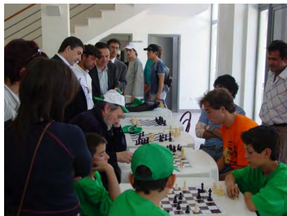
Torneio de xadrez integrado nas comemorações do 25 de Abril