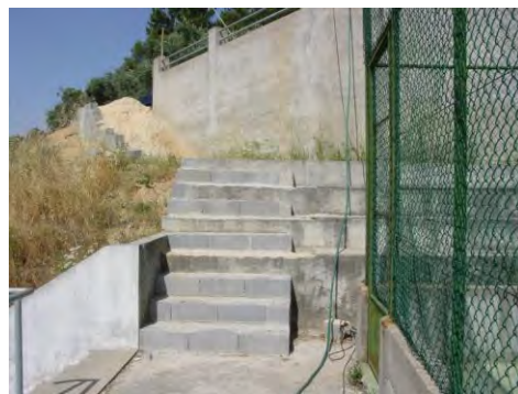
Escada de Acesso ao Polidesportivo de Aldeia de Ana de Avis