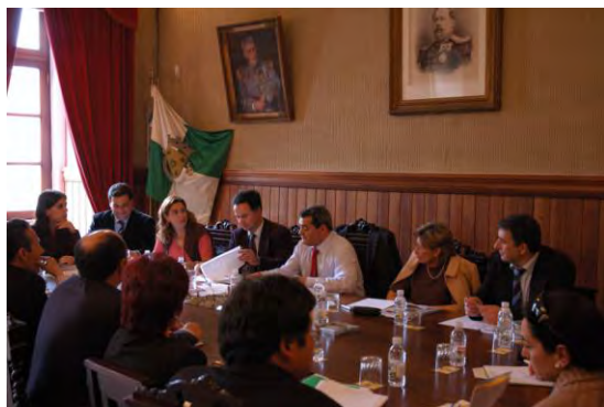
Reunião de trabalho no Salão Nobre com o Sr. Governador Civil de Leiria