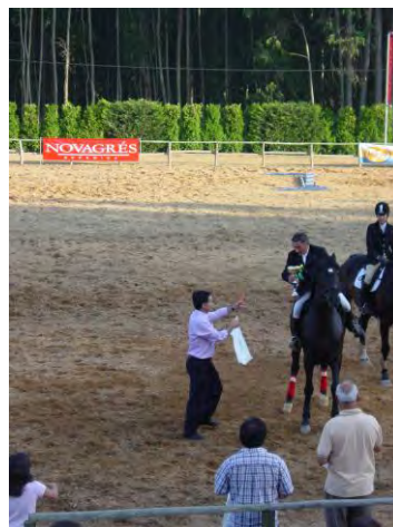
Entrega de prémios do concurso de saltos de hipismo