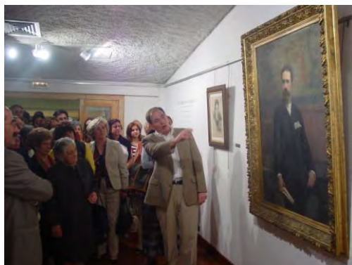
Exposição na Casa da Cultura de Obras do Mestre Malhoa