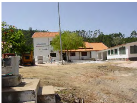
Arranjos no largo da capela em Alge - Campelo