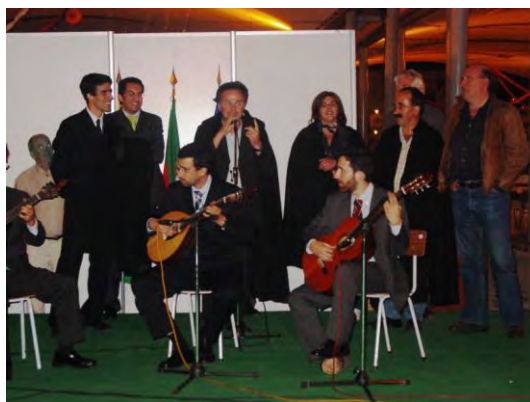
Actuação de grupo de fados de Coimbra