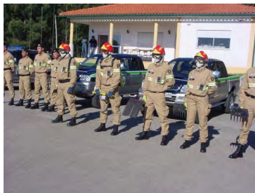
Visita ao Grupo de Intervenção Protecção e Socorro (GIPS) sedeados em Figueiró dos Vinhos