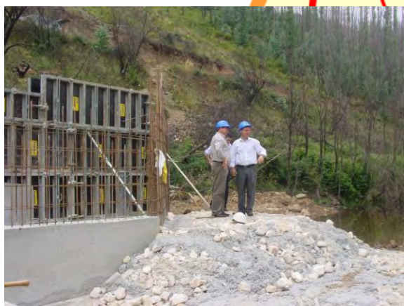
Construção de açude para pesca desportiva em Poeiro