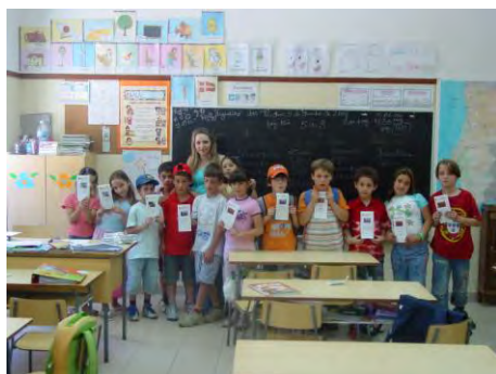
Dia Mundial do Ambiente