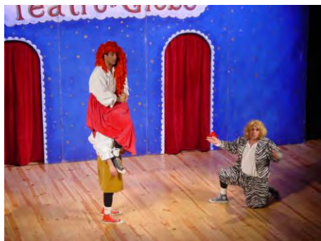
Dia Mundial do Teatro