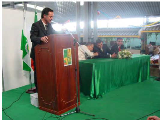
Cerimónia de abertura da VI FIGEXPO