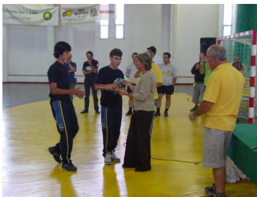
Entrega de prémios do Torneio Internacional de Andebol de S. João