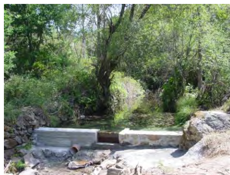
Captação de água em Pé de Ingote - Campelo