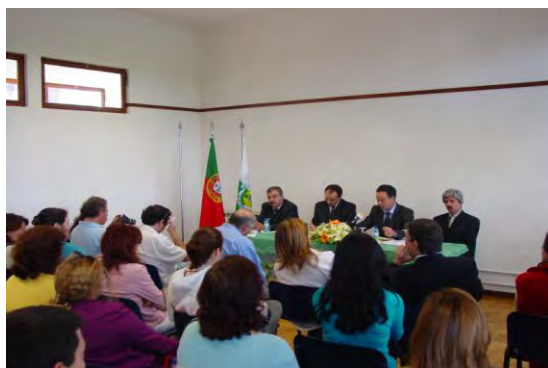
Cerimónia de inauguração do Centro de Formação