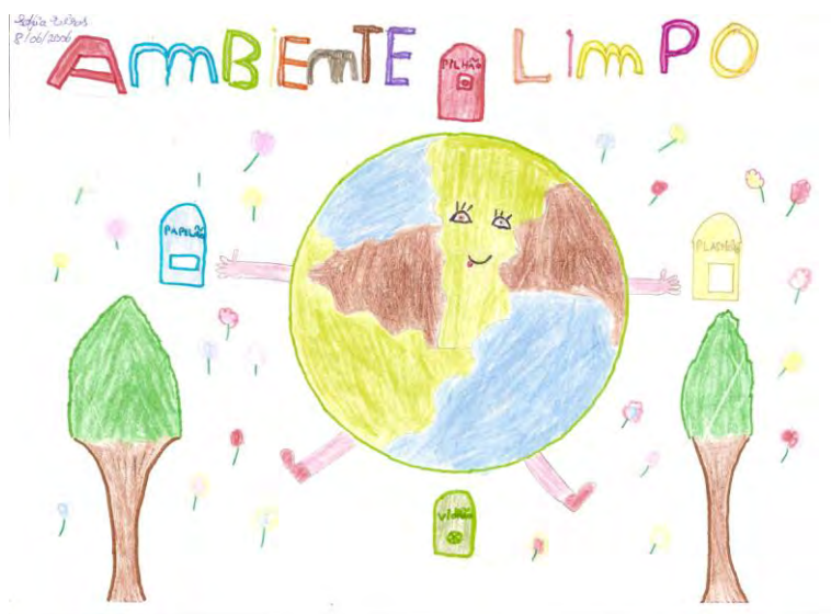
Sofia Eiras – 1º Ciclo