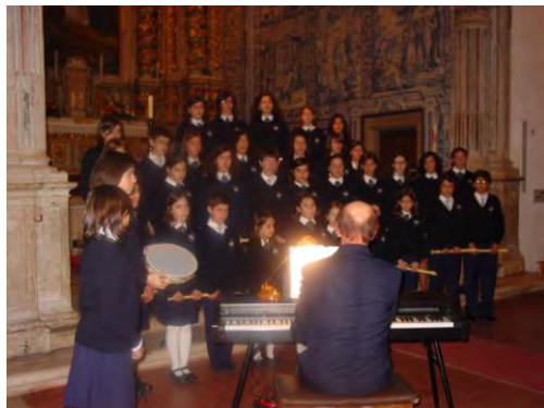
Concerto de Natal na Igreja Paroquial