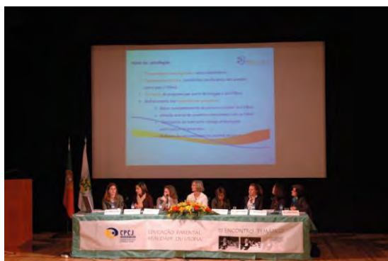
15 de Março de 2006 III encontro CPCJ's de Figueiró dos Vinhos