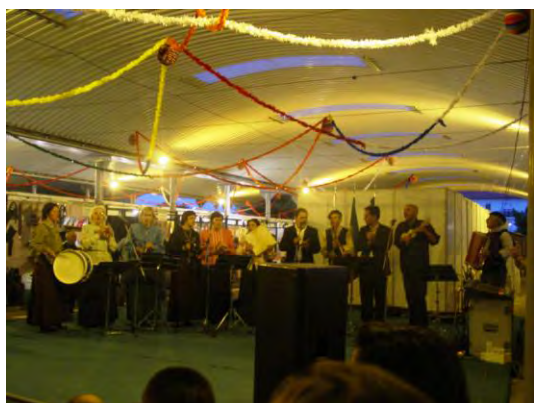
Actuação do grupo Tradições de Castanheira de Pêra