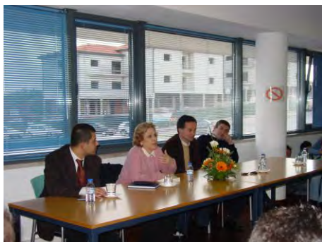
Dia Mundial do Livro