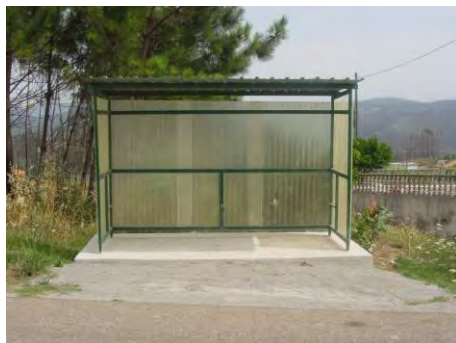
Abrigo para passageiros em Jarda