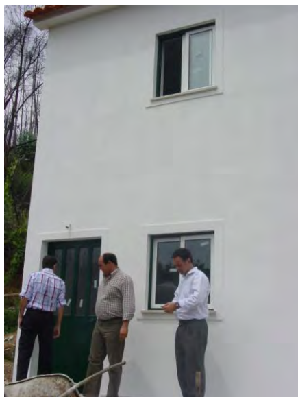
Pormenor de uma habitação na Bouça recuperada em parceria com a Caritas Diocesana