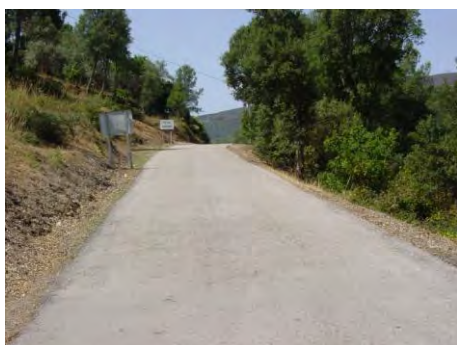
Limpeza de Bermas em Pé de Janeiro - Campelo