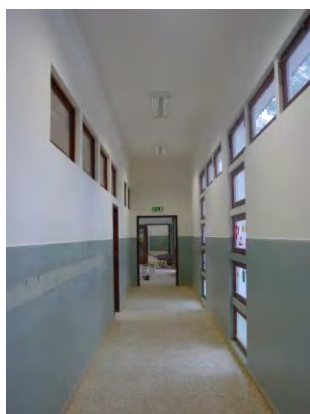
Escola n.º 2