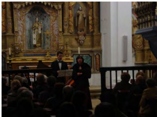
Concerto de Música Barroca no Convento do Carmo