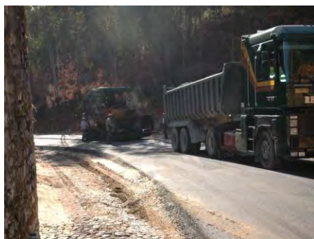
Beneficiação da E.M. 524 em Aldeia de Ana de Avis