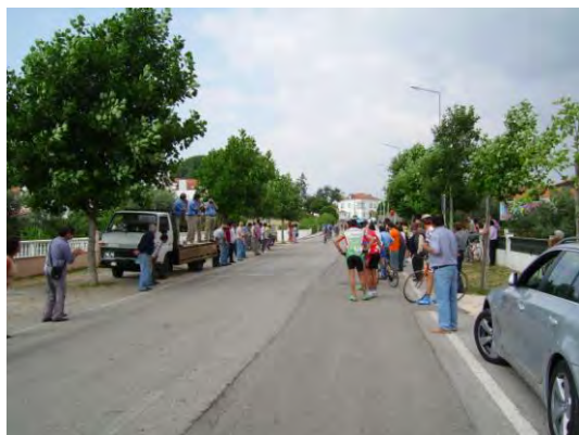
I Grande Prémio de Ciclismo de Figueiró dos Vinhos