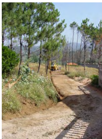
Limpeza de Caminho em Arega