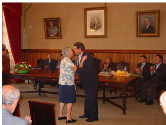
Entrega de prémios do concurso Figueiró Florido