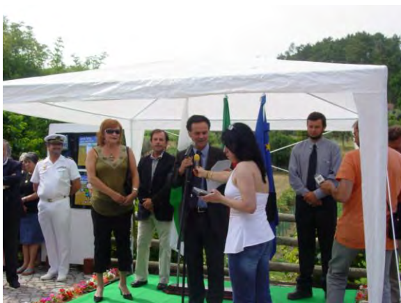
Cerimónia do hastear da bandeira azul na praia fluvial de Aldeia de Ana de Avis

O futuro constrói-se apostando na INOVAÇÃO e no DESENVOLVIMENTO.