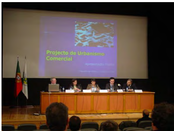
Conferência realizada na Casa da Cultura no âmbito do Projecto Urbcom