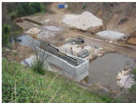
Construção de açude em Poeiro