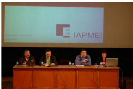
Apresentação do Programa Modcom