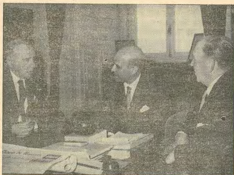
« Sir » Eric Louw, Ministro dos Negócios Estrangeiros da República da África do Sul, conversando com o Sr. Ministro do Ultramar, Comandante Peixoto Correia.

Rejubilamos com o facto e formulamos ardentes e sinceros votos dum pronto restabelecimento.