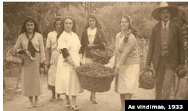
As vindimas, 1933