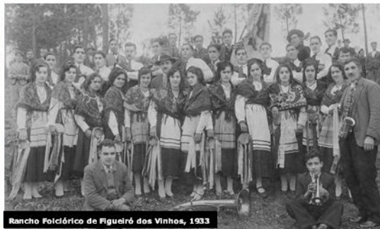
Rancho Folclórico de Figueiró dos Vinhos, 1933