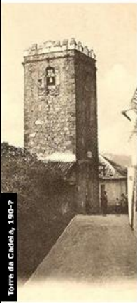
Torre da Cadeia, 190-7