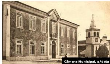
Câmara Municipal, s/data