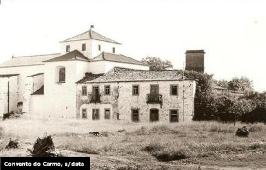
Convento do Carmo, s/data