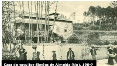
Casa do escultor Simões de Almeida (tio), 190-7