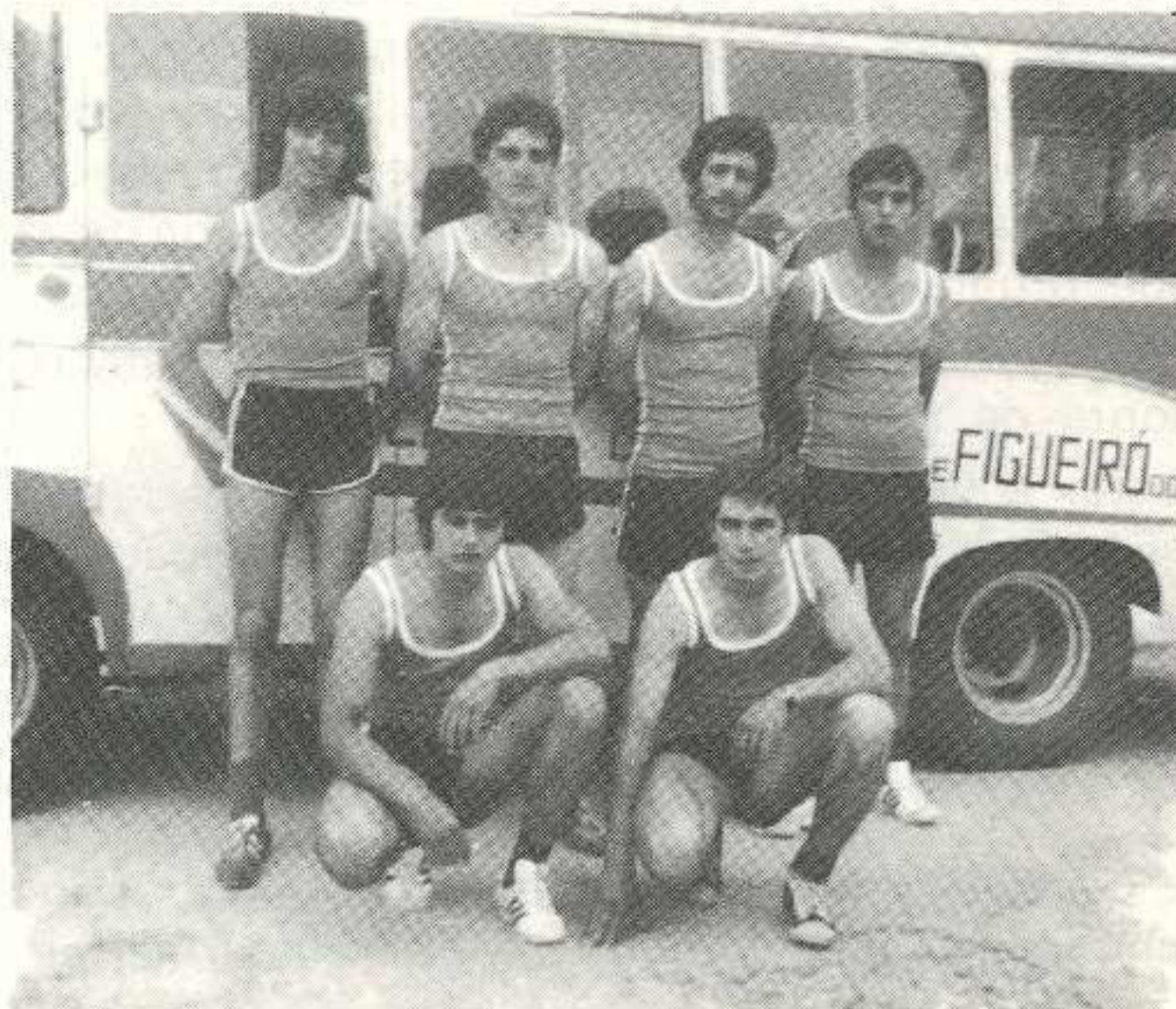
Equipa de Atletismo