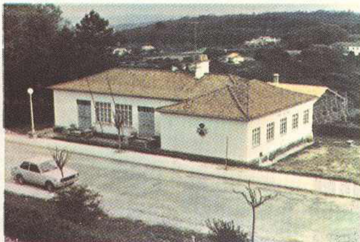
— Lado Norte

Por Alvará de 14 de Maio de 1934, foi instalada a CASA DO POVO de Figueiró dos Vinhos depois de terem sido oficialmente aprovados os seus Estatutos pelo então Subsecretário das Corporações e Previdência Social, Doutor Pedro Teotónio Pereira.