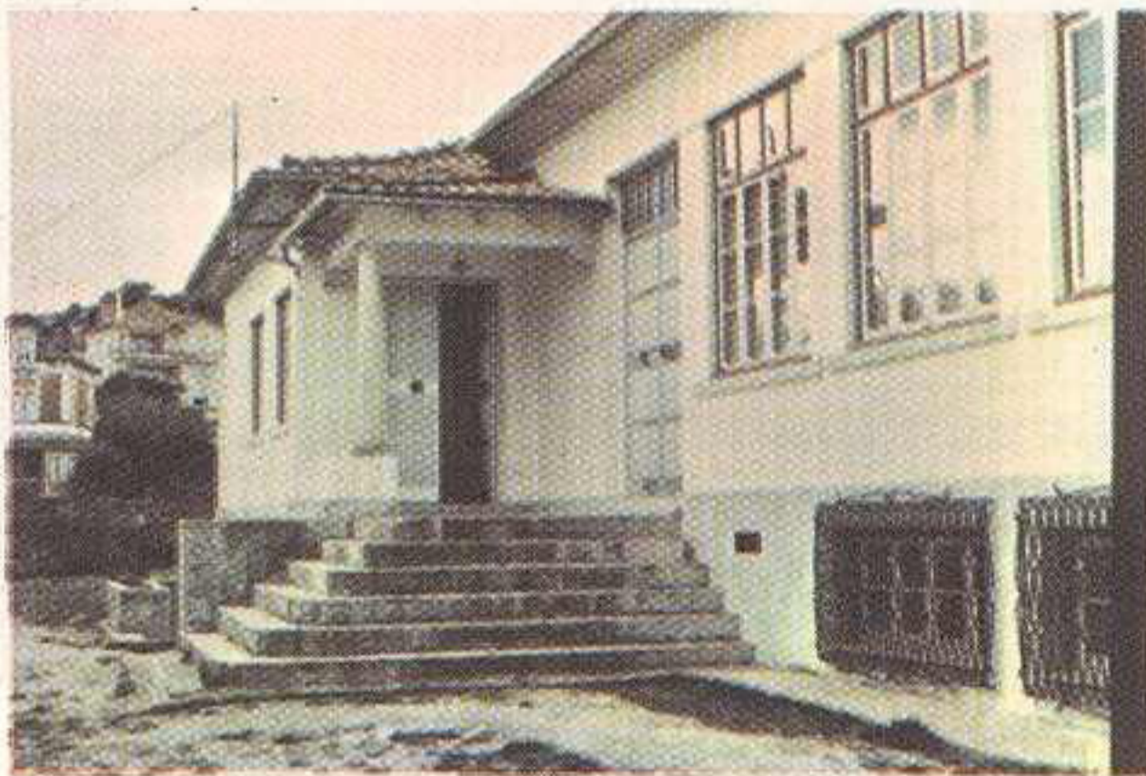
— Lado Sul

Para a criação deste organismo, que então era parte integrante do sistema CORPORATIVO vigente, foi sacrificada a Associação Recreativa, mais conhecida por Associação Operária. De acordo com