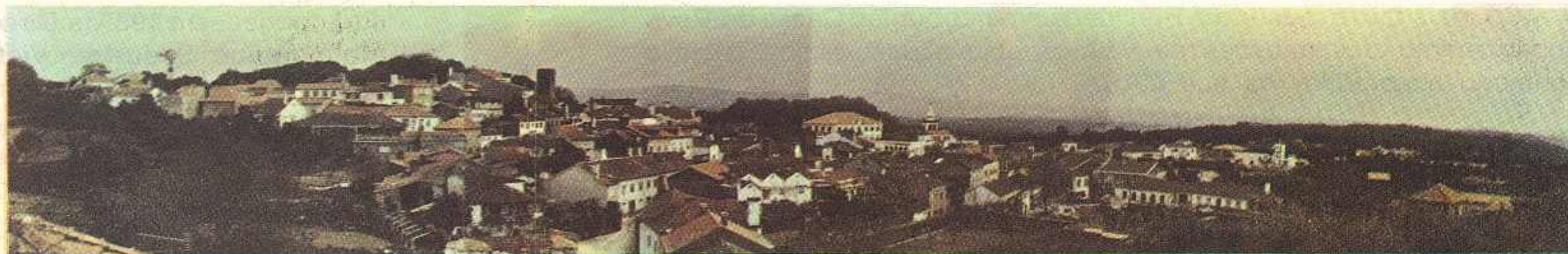
FIGUEIRÓ DOS VINHOS — uma panorâmica da Vila