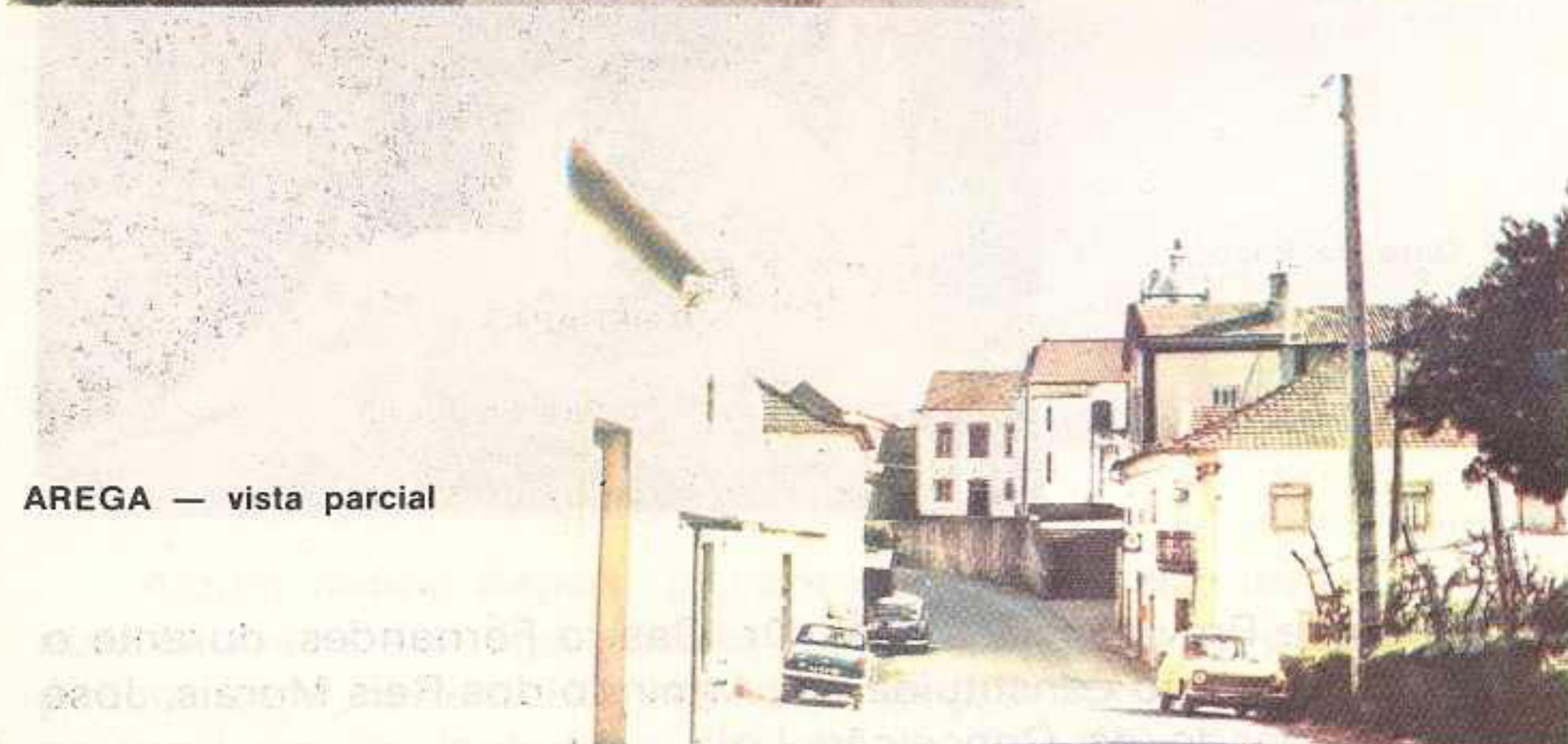
AREGA — vista parcial