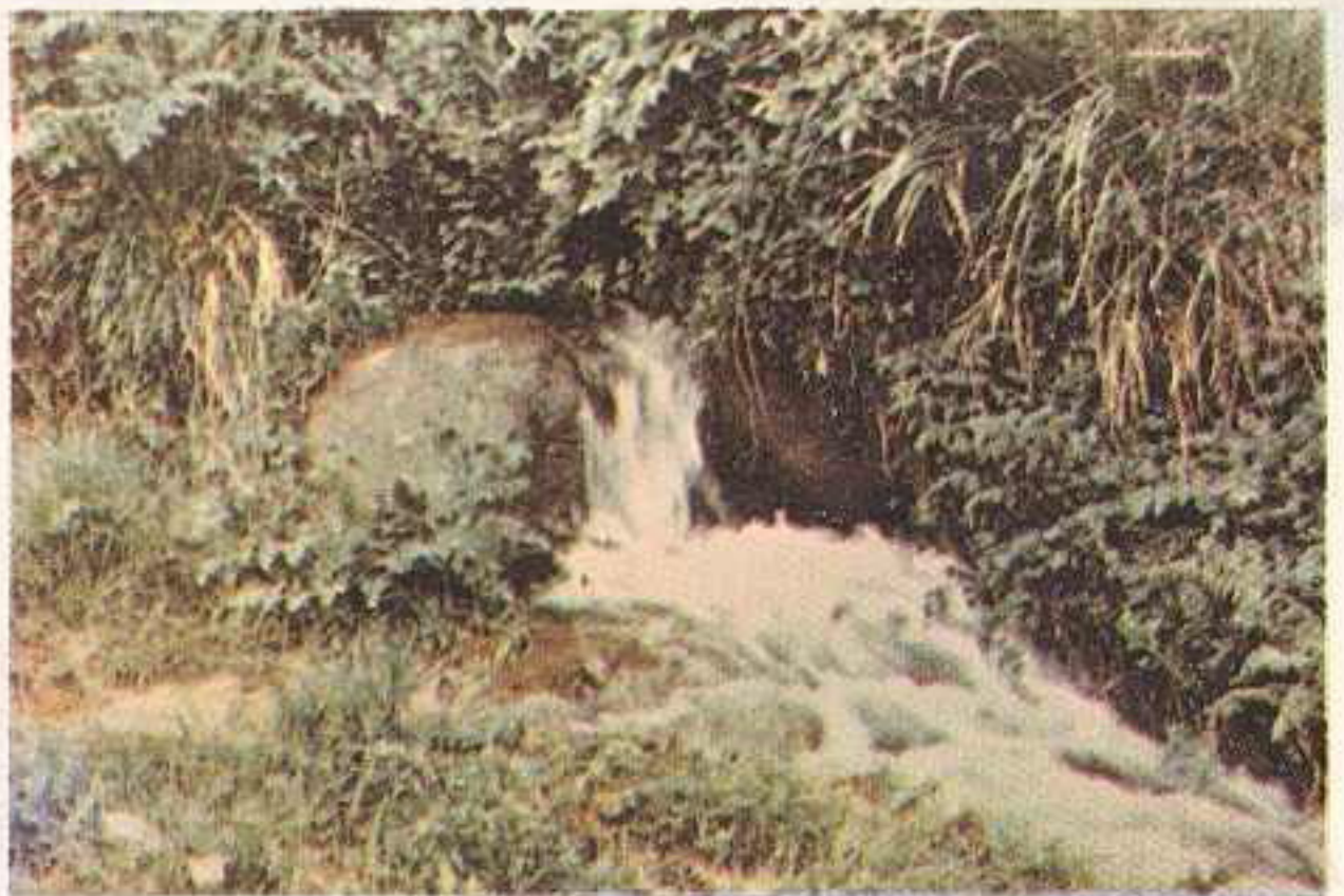
O Ouro do Povo