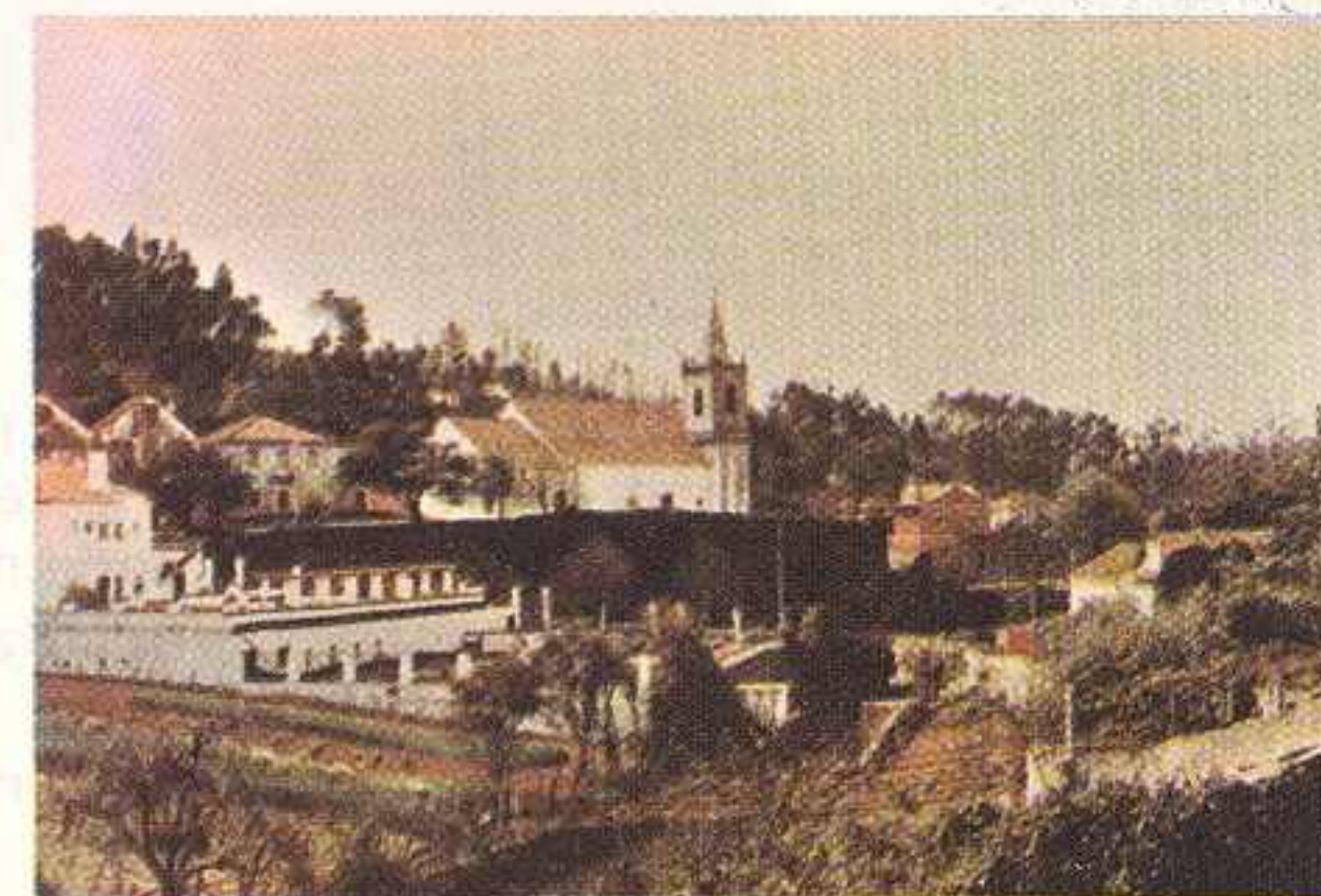
CAMPELO — vista parcial

Em princípio as Casas do Povo, limitavam-se a distribuir pequenos subsídios a pessoas extremamente pobres ou doentes, mas como as receitas eram igualmente pequenas, pouco podiam distribuir.