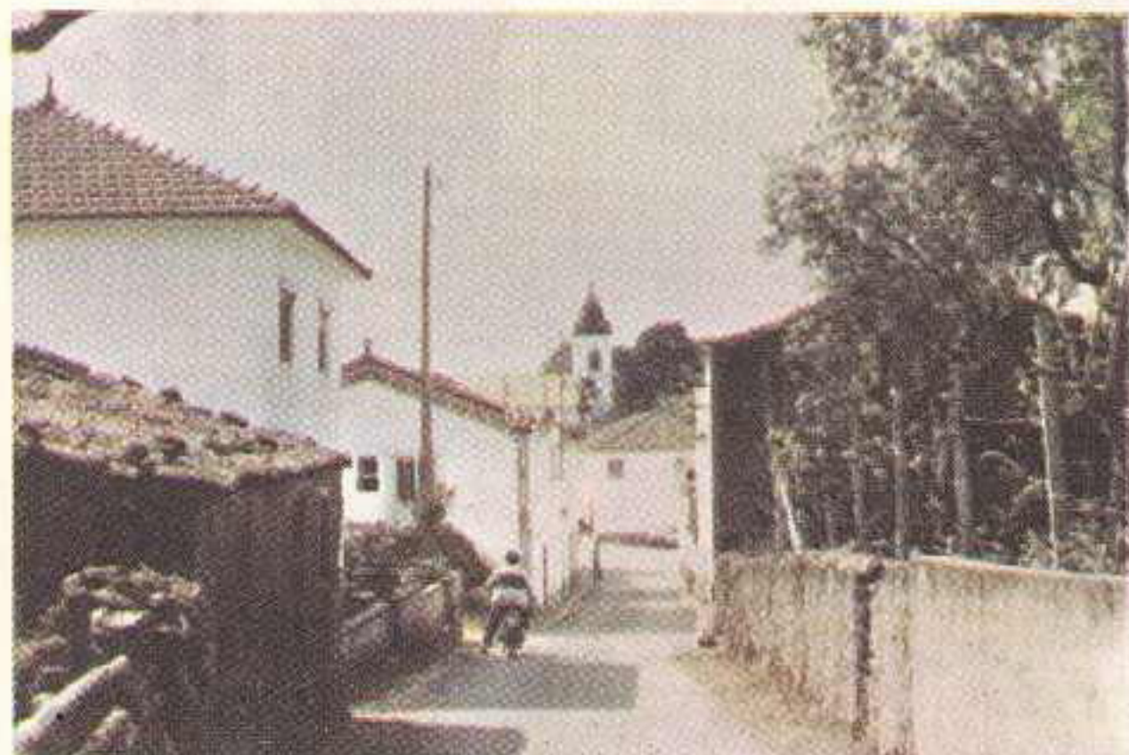
AGUDA — vista parcial